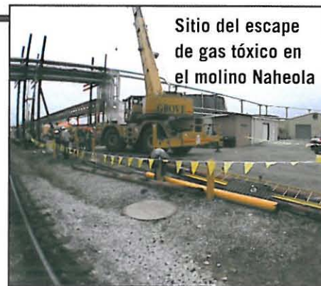
Sitio del escape de gas tóxico en el molino Naheola

La causa inmediata del accidente fue la reacción química inesperada que produjo gas de sulfuro de hidrógeno. Al estudiar las causas básicas, la CSB descubrió que la planta —entonces, propiedad de James River Corporation— no siguió las buenas prácticas de ingeniería cuando en 1995 conectó el drenaje de la fosa de recolección al conducto del drenaje donde se agregaba el ácido periódicamente. No hubo revisión de los peligros potenciales que pudieran resultar cuando los químicos de la fosa de recolección se mezclaran con otros materiales en el conducto del drenaje. La planta no identificó la estación de descarga como un área de riesgo por sulfuro de hidrógeno y no instaló ningún dispositivo de advertencia de la presencia de gas.